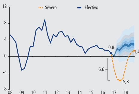
GRÁFICO IV.11 Crecimiento anual del PIB (*) (trimestral, porcentaje)

Los ejercicios de tensión se basan generalmente en situaciones extremas pero plausibles. En este contexto, los resultados reportados en los IEF de los últimos cuatro años, utilizan un escenario de tensión que replica una caída promedio de la actividad en periodos de fragilidad financiera. Dicho escenario —que denominaremos severo para efectos de este recuadro— considera una desaceleración del crecimiento del PIB de 6,6pp en tres trimestres a partir del período de referencia. Adicionalmente, se supone un nivel de convergencia para el crecimiento del PIB hacia los 2 años, el cual tiene una diferencia similar a la del crecimiento promedio previo y posterior a la crisis asiática. Así, en el ejercicio actual el escenario severo considera que el crecimiento del PIB converge a 1,4% anual (línea discontinua, gráfico IV.11).