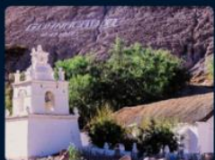
Arica y Parinacota