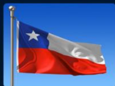
Todas las regiones