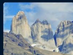
Magallanes y de la Antártica Chilena