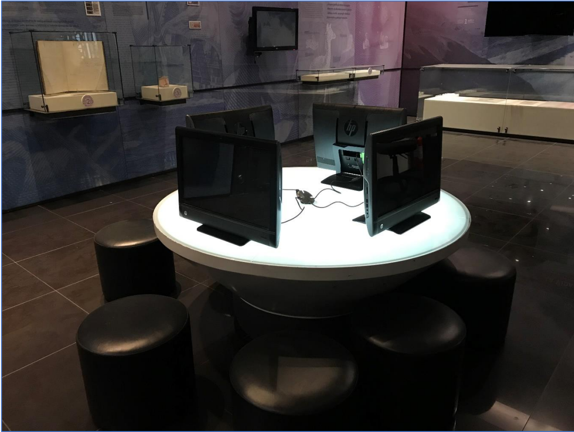
Imagen 3. Ubicación de PCs All in One multimedia: