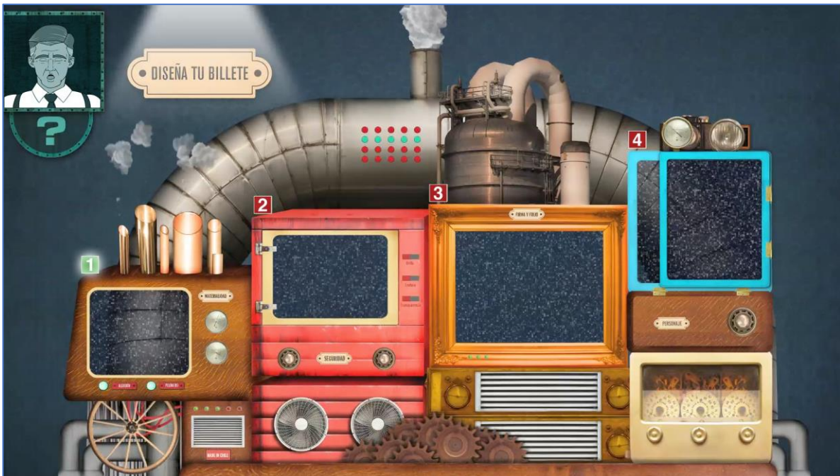
Imagen 1. Interior del juego “Diseña tu billete”

El Banco proveerá toda la información disponible a la empresa adjudicataria respecto a las funcionalidades esperadas para el juego educativo “Diseña tu Billeto”, junto con los contenidos que el juego deberá mostrar.