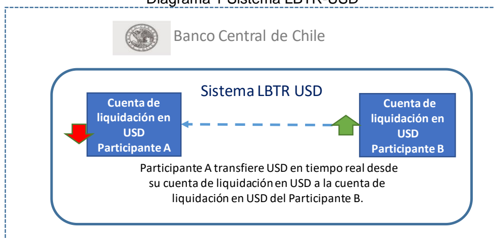
Diagrama 1 Sistema LBTR-USD