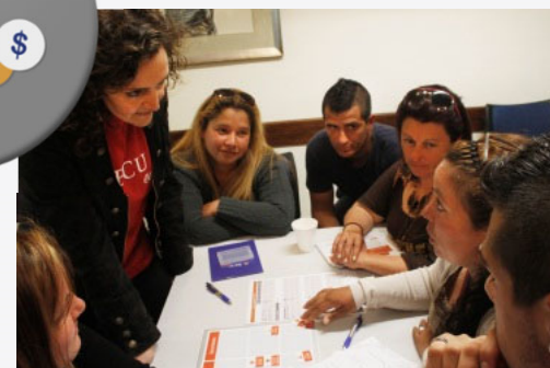
Talleres de Educación Económica y Financiera para Trabajadores y Familias