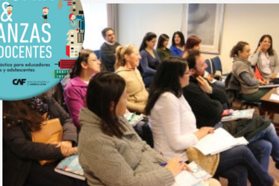
Programa de Capacitación Docente