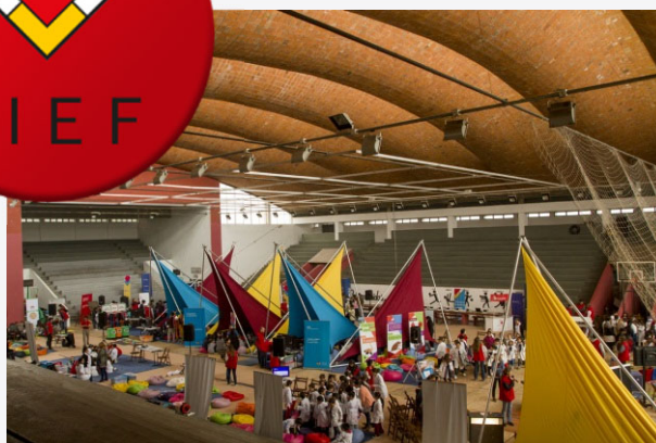
Feria Interactiva de Economía y Finanzas