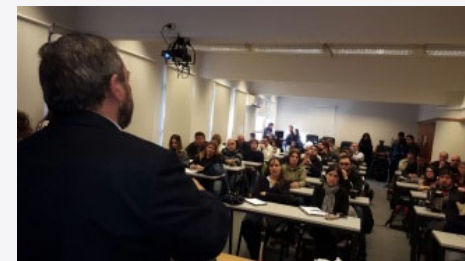
Curso de Economía para periodistas y sindicalistas