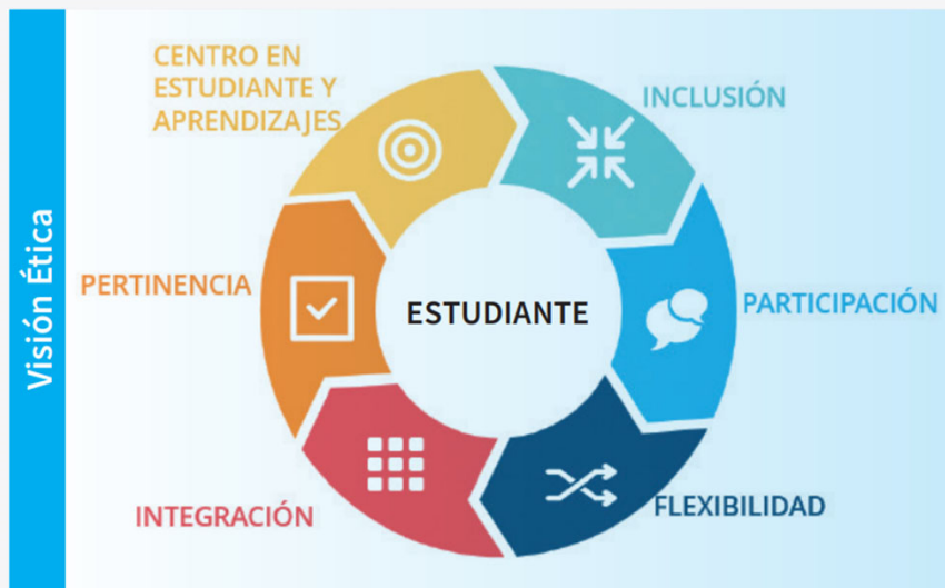
Figura 1. Principios del Marco Curricular Nacional.

Ente autónomo que regula la planificación, gestión y administración del sistema educativo en todo el territorio nacional.