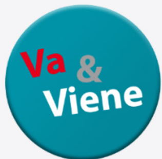
Va & Viene Derechos y Economía