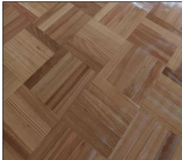
Patrón de instalación: Estocolmo

No se permitirá la instalación de piezas con defectos visibles tales como nudos sueltos, grietas, fisuras, cavidades, deformaciones, alabeos, diferencias dimensionales fuera de tolerancia o cualquier condición que afecte la calidad final del piso. El Encargado Técnico del Banco podrá rechazar piezas o sectores que no cumplan con estas condiciones, debiendo la Empresa reemplazarlos a su cargo.